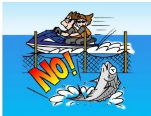
漁業施設に近づかない