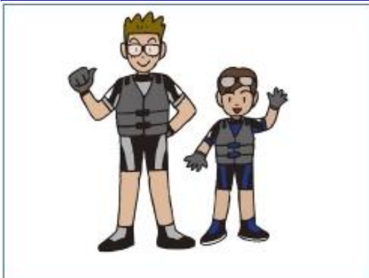
ライフジャケット装着義務違反