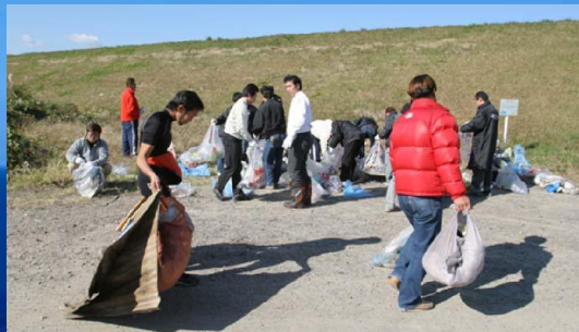
各地でのビーチクリーン活動

PWCは機動性の高さや安全性から様々な場面でレスキュー艇や安全監視艇として協力要請をいただく機会が増えてきています。PWSAではこれらの要請に対して、該当エリアのライダーの方々のご協力のもと水上安全に関する運営協力などを行なっています。今後はゲレンデの健全な利用に向けて「安全指導員」の育成活動にも取り組んでいきます。