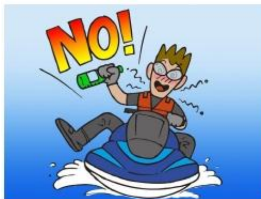
酒酔い操縦などの禁止