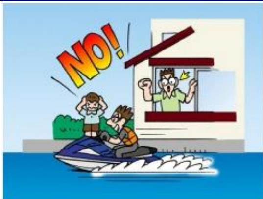
住宅付近では乗らない