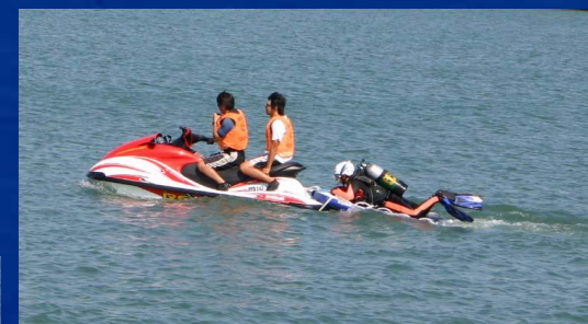
安全啓発パトロール